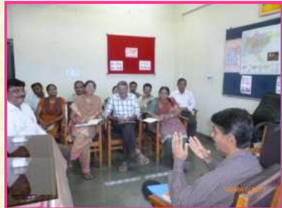
માન. નિયામકશ્રીની પ્રેરણા મુલાકાત