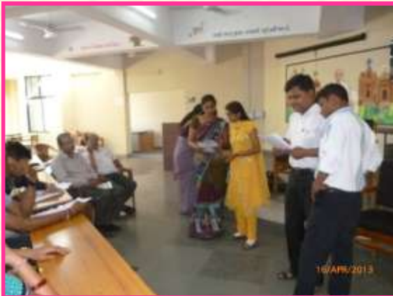
મૂલ્યવર્ધક સંપૂર્ણ રચના વર્કશોપ

બાળકોમાં વિવિધ મૂલ્યો પ્રસ્થાપિત થાય તે હેતુસર તા. 07/05/2013 ના રોજ સીઆરસી કો-ઓર્ડિનેટર માટે ડાયેટ ખાતે મૂલ્યવર્ધક સંપૂર્ણ રચના વર્કશોપ યોજવામાં આવ્યો. હતો.